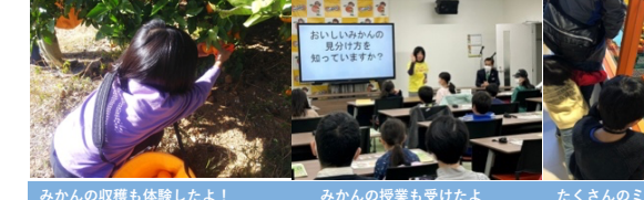
みかんの収穫も体験したよ！ みかんの授業も受けたよ たくさんのミカンが運ばれてるね

日時／2023年 11月25日(土) 9:45～11:45 場所： JA みっかび 柑橘選果場 (浜松市) 発行： NPO 法人子ども未来