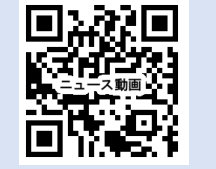
8月25日 SBS ニュース