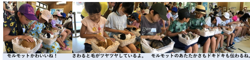
モルモットかわいいね！ さわると毛がツツツしているよ。 モルモットのあたたかさもドキドキも伝わるね。