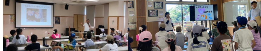
動画や写真を使って、どんな世話をしているのか、何が大事なのか、わかりやすく教えていただきました。

日時/2023年 8月25日(金) 10:00~12:00 場所: 浜松市動物園 発行: NPO 法人子ども未来