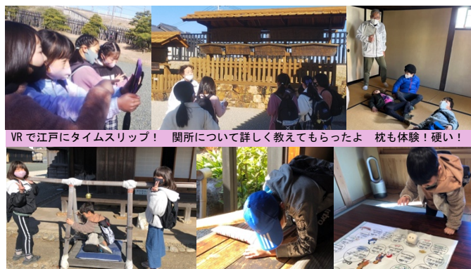
VRで江戸にタイムスリップ！ 関所について詳しく教えてもらったよ 枕も体験！硬い！

十二年目のふじのくに子ども観光大使講座の最終回。晴天に恵まれ、子ども十六名、保護者十二名の参加でした。 新居関所は、日本「四大関所」の一つです。徳川家康が一六〇〇年に設置しました。日本で唯一現存し、敷地面積が日本一広いことで知られています。当時は江戸を守るため、「出女」と「入鉄砲」を厳しく取り締まりました。新居宿史跡案内人の方の解説を聞きながら、学んでいました。関所の解説、VR体験、かご乗り体験、版画、すごろくなどたくさんありました。VR体験を体験させていただきました。当時はたご屋を再現している紀伊国屋史料館でも、たつぶり見学でき、参加した子供たちも保護者の方も大満足でした。