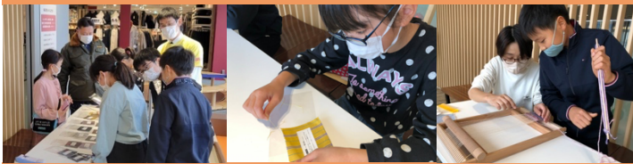
端の糸をほどこいてコースター作り