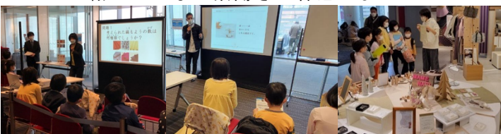
遠州綿や遠州紬の歴史についての授業

今回の会場は、クリスマスの素敵な飾りに囲まれた遠鉄百貨店で、ぬくもり工房の社長、遠州綿紬の歴史についてお話を聞き、参加者も興味深く聞いていました。また、遠鉄百貨店のぬくもり工房の売り場見学では、素敵な商品を手に取りながら、店員さんに説明をしていただきました。 コースター作り、機織り体験では丁寧に自分の作品を仕上げることを学びました。