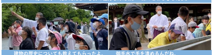
建物の歴史についても教えてもらったよ。 御手水で手を清めるんだね。