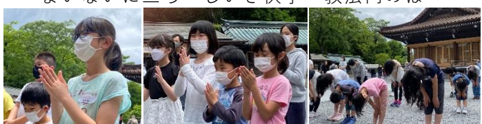
二礼二拍手一礼がたたい参拝の仕方なんだね。 深々とおじぎしたよ。

日時/2022年 5月22日(日) 10:00~12:00 場所： 三嶋大社/三島市 発行： NPO 法人子ども未来