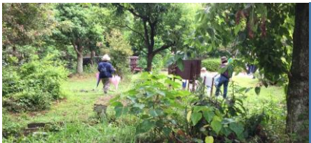
講座終了後、雨が止み、昆虫採集を特別に体験させていただきました。